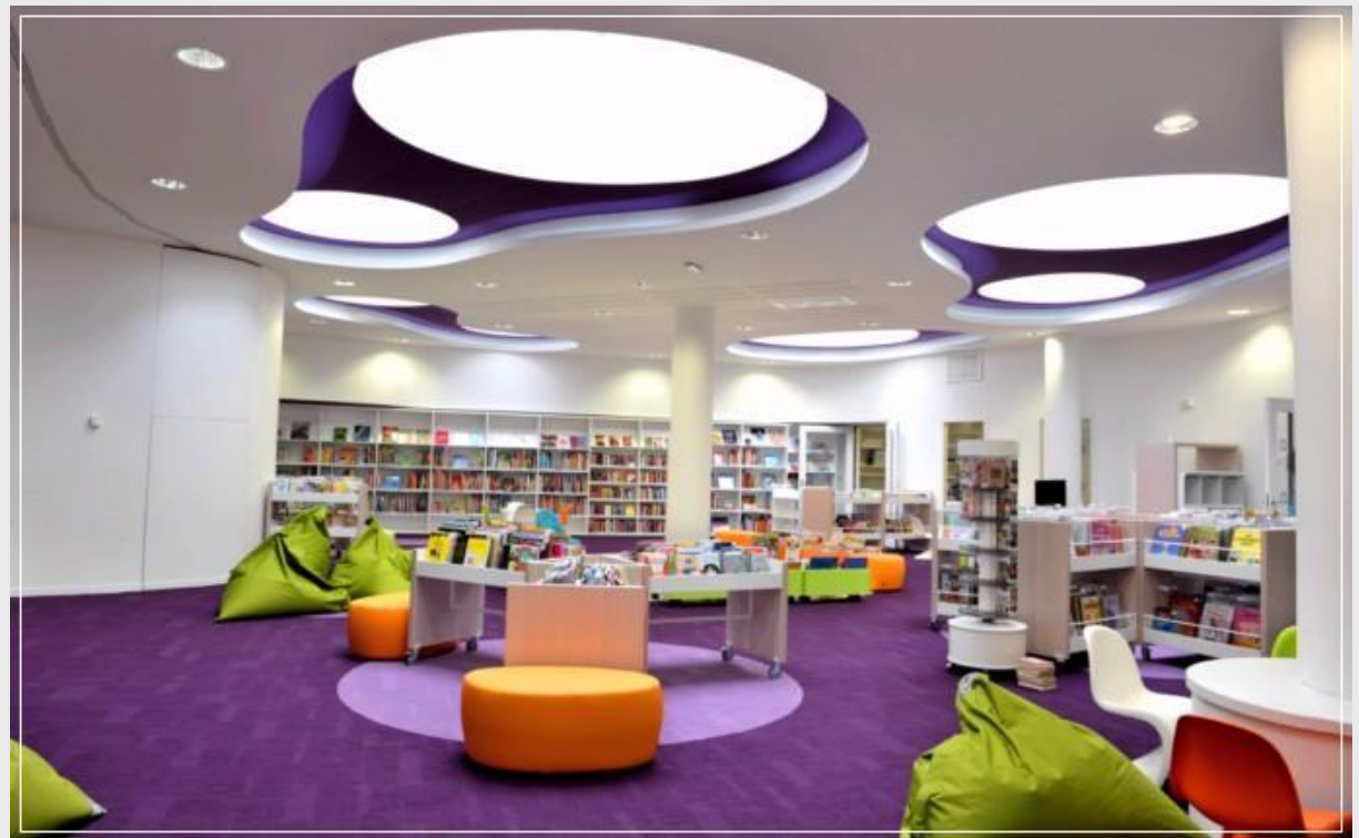
Bibliothèque Flora Tristan Bordeaux