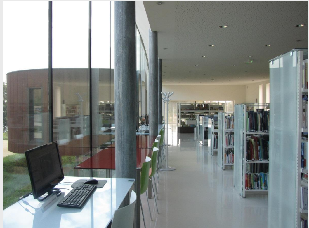
Médiathèque de La Suze sur Sarthe