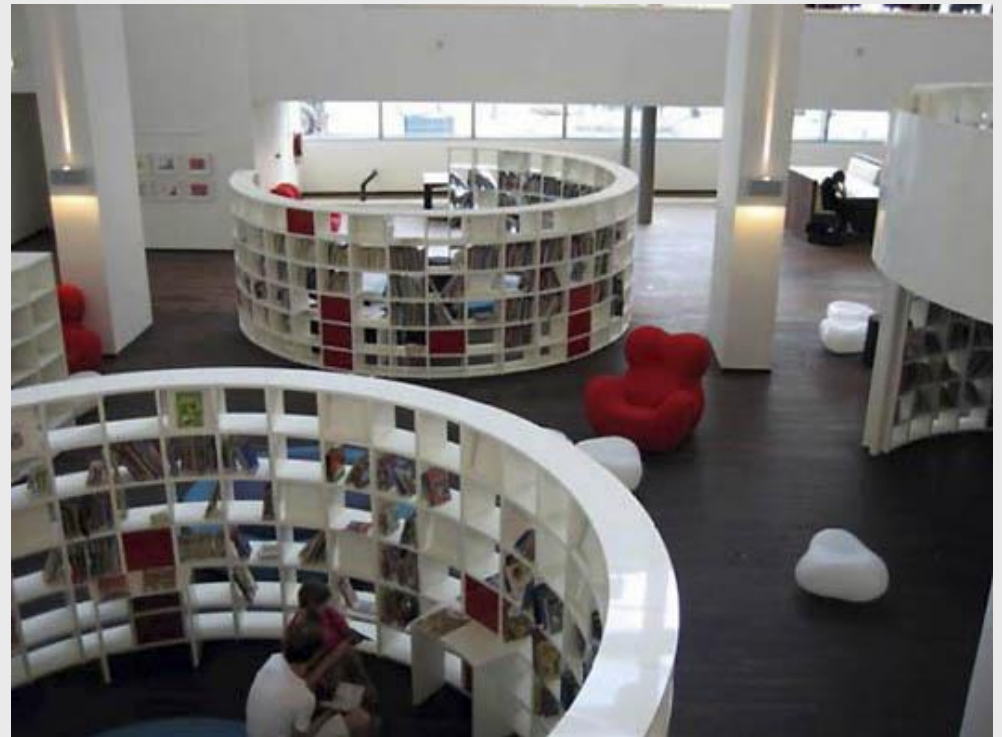
Espace jeunesse bibliothèque d'Amsterdam