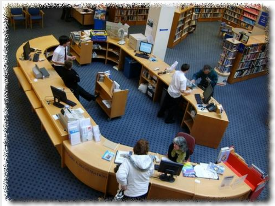
Bibliothèque de Jersey