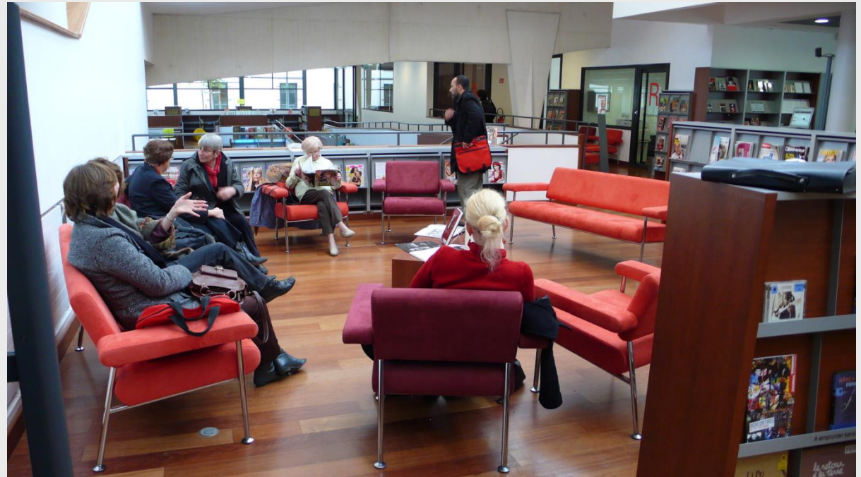
Médiathèque Viroflay Yvelines