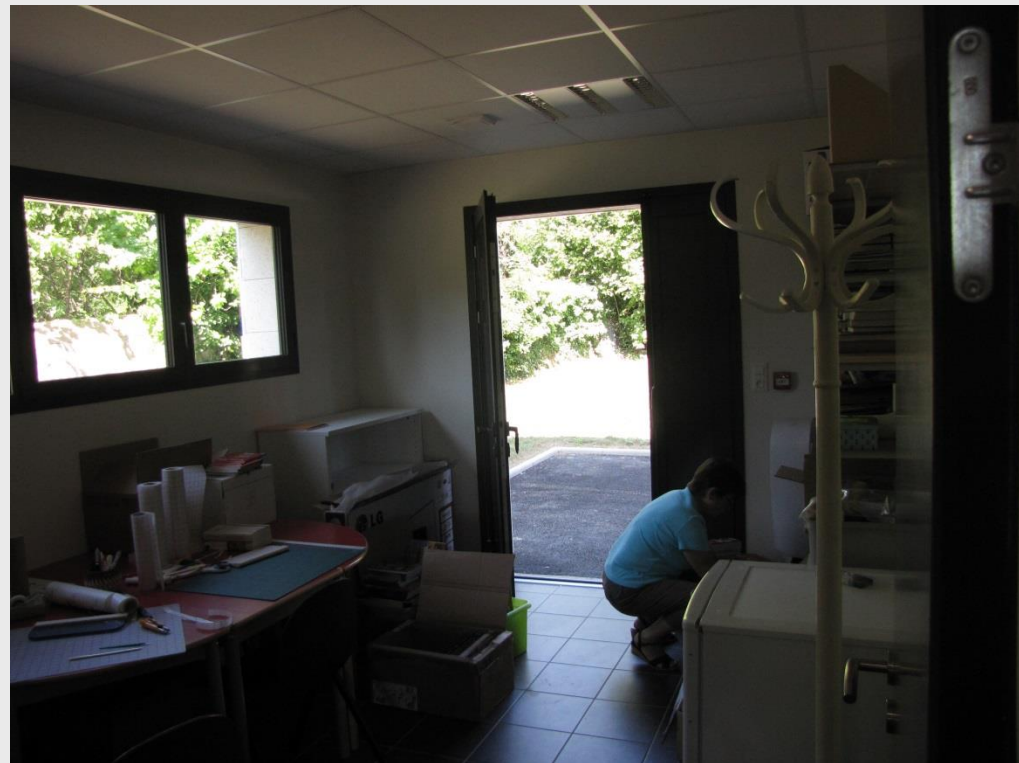
Médiathèque de Bessé-sur-Braye