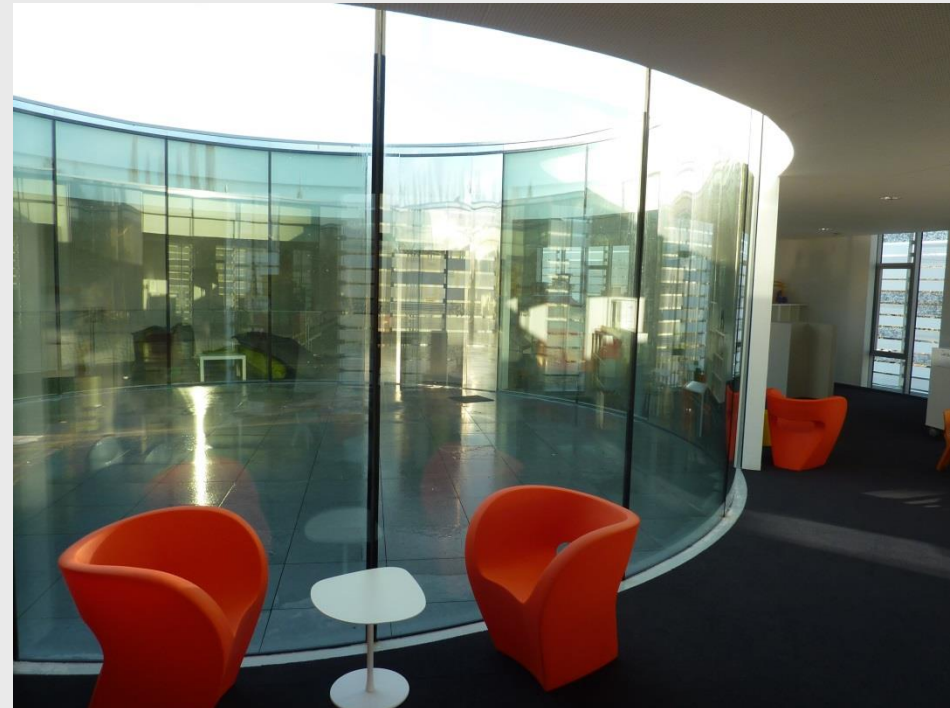
Médiathèque La Ferté Bernard